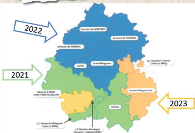
Une mise en place progressive précédée d'une année pédagogique

L'objectif est celui d'une transition en douceur entre les deux modes de facturation. Une facture pédagogique sera adressée à l'issue des 6 premiers mois de fonctionnement du nouveau système afin d'indiquer aux usagers le montant qu'ils auraient payé et leur permettre d'adapter éventuellement leurs comportements pour maîtriser leur facture. Durant cette période, la TEOM sera toujours en vigueur.