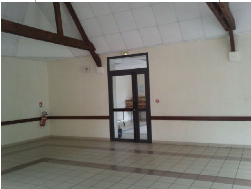
Porte d'accès au local cuisine depuis la grande salle