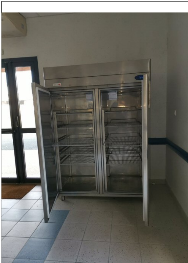
Local cuisine, l'armoire froide de grande contenance