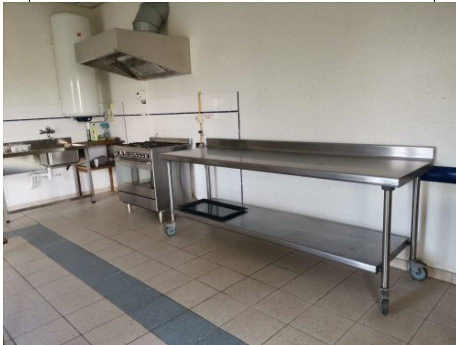
Local cuisine, grande table de service ainsi que le point de cuisson