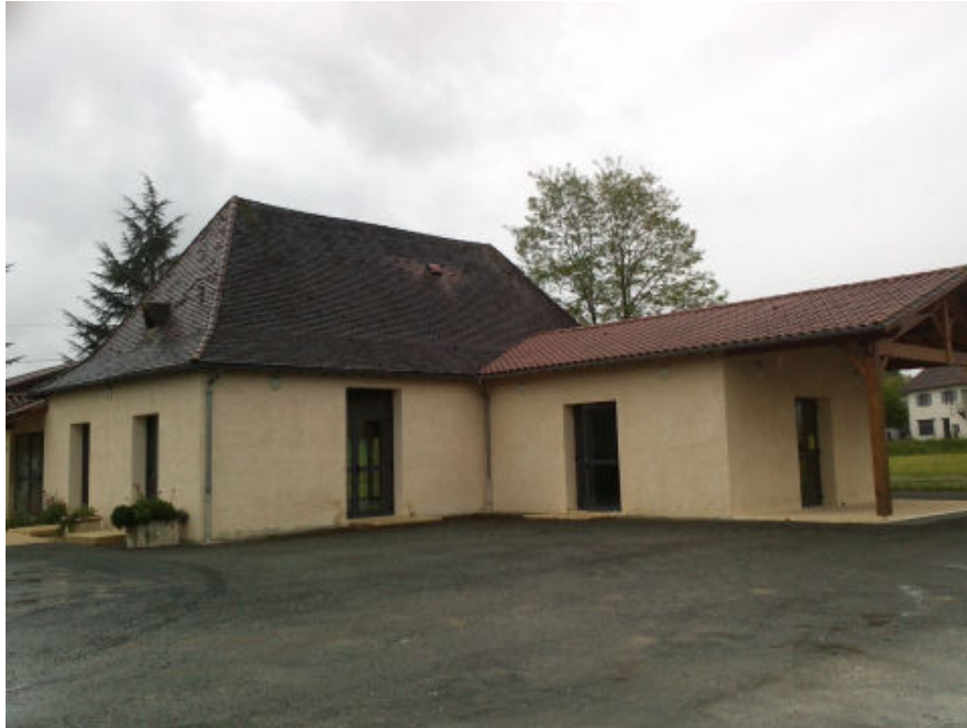
Vue extérieure de la salle des fêtes. La grande salle de réception et le local cuisine attenant