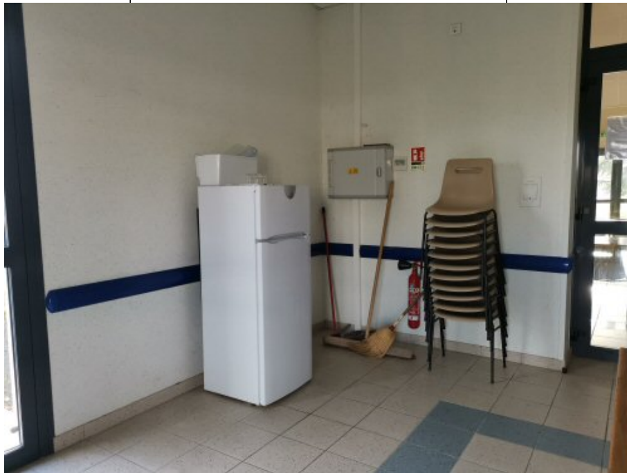
Local cuisine, un petit réfrigérateur d'appoint