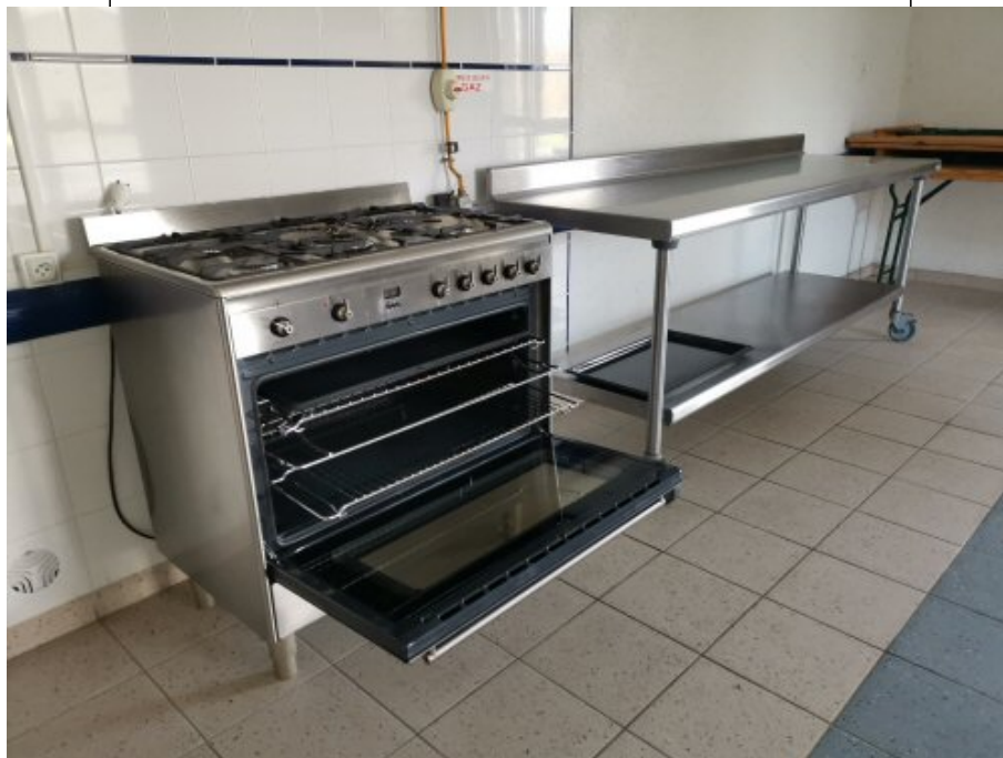
Local cuisine, le point de cuisson équipé de plusieurs grilles