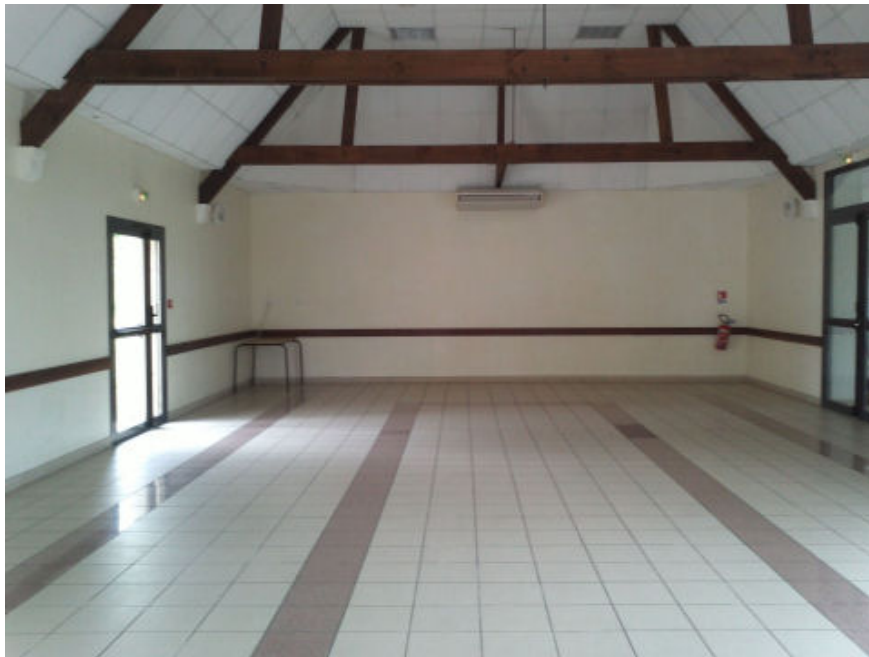
La grande salle de réception, pouvant accueillir une centaine de personnes