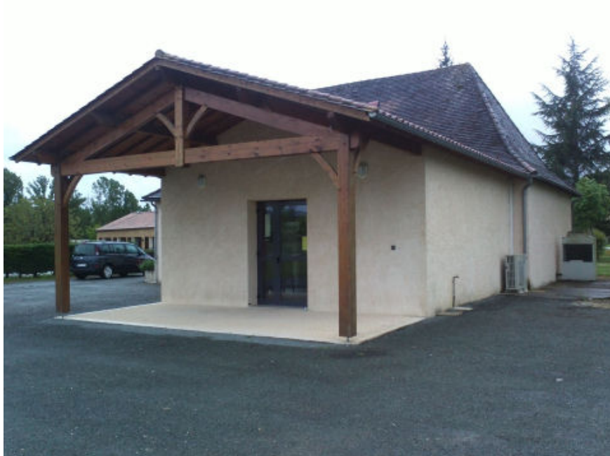
Vue extérieure du local cuisine