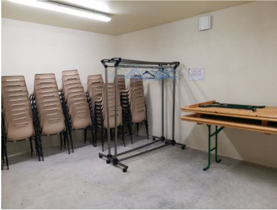
Local de rangement des tables et des chaises, directement accessible depuis la salle de réception