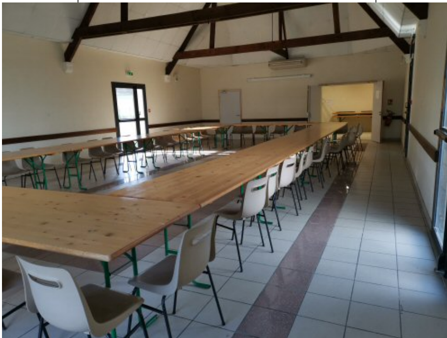
Exemple de configuration de la salle de réception