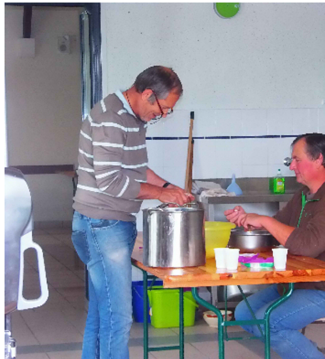
Nos 3 maîtres-queux